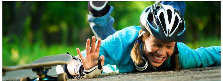
Ejemplo de una caída sobre la mano o muñeca extendida llamada FOOSH

Esta fractura normalmente se debe a una caída sobre la mano extendida o se presenta durante deportes de contacto y actividades físicas. Los huesos forman nuestro sistema esquelético y cuando se les pone mucha fuerza, pueden fracturarse. Ciertos factores de riesgo, por ejemplo, osteoporosis o baja densidad ósea hacen que sea más probable que ocurra una fractura distal del radio.