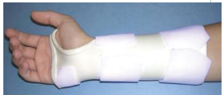
Férula hecha a la medida para limitar el movimiento en una muñeca con un quiste ganglionar

Para encontrar un Terapeuta de mano en su área visite la American Society of Hand Therapists en www.asht.org o llame al 856-380-6856.