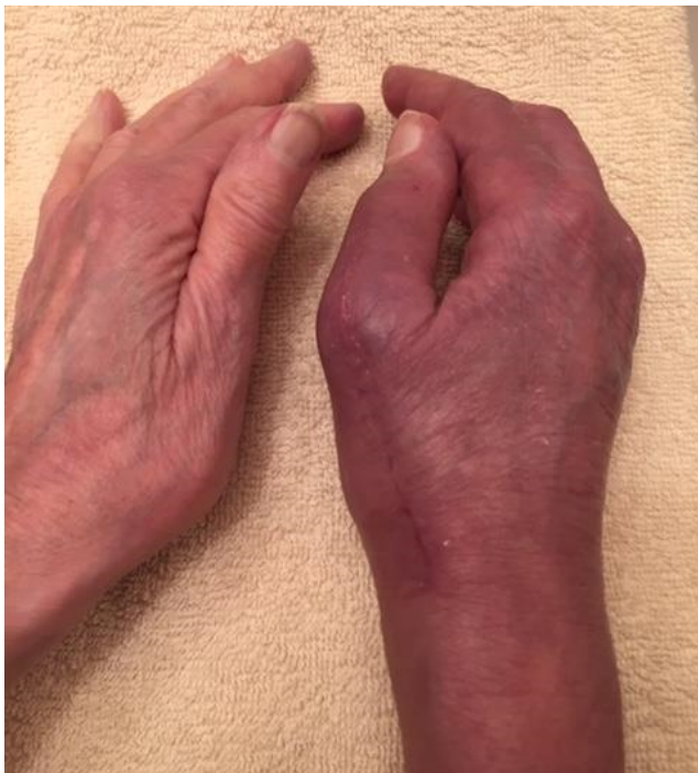
Con el SDRC pueden presentarse rigidez, inflamación y cambios en el color de la mano

El dolor asociado con el SDRC se presenta en el área de la lesión o se puede propagar en toda la extremidad. Las personas con SDRC pueden tener una respuesta inusual a algo doloroso o una respuesta dolorosa a algo que normalmente no sería doloroso.